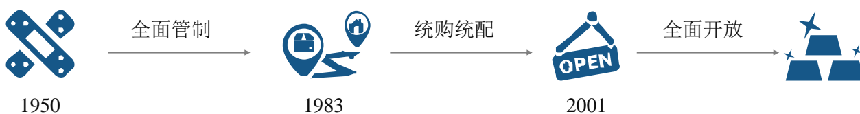
我国黄金市场的开放进程

近年来，我国黄金市场总体呈快速发展态势，目前已成为全球最大的黄金供应国和黄金消费国。实际上，自新中国成立以来，我国黄金产业经历了从全面管制到政策逐步开放、商品和投资市场逐步发展成熟的过程，实现了从高度集中到市场化，再到国际化的转变。自建国以来，我国黄金产业的发展大致可以分为以下三个阶段：